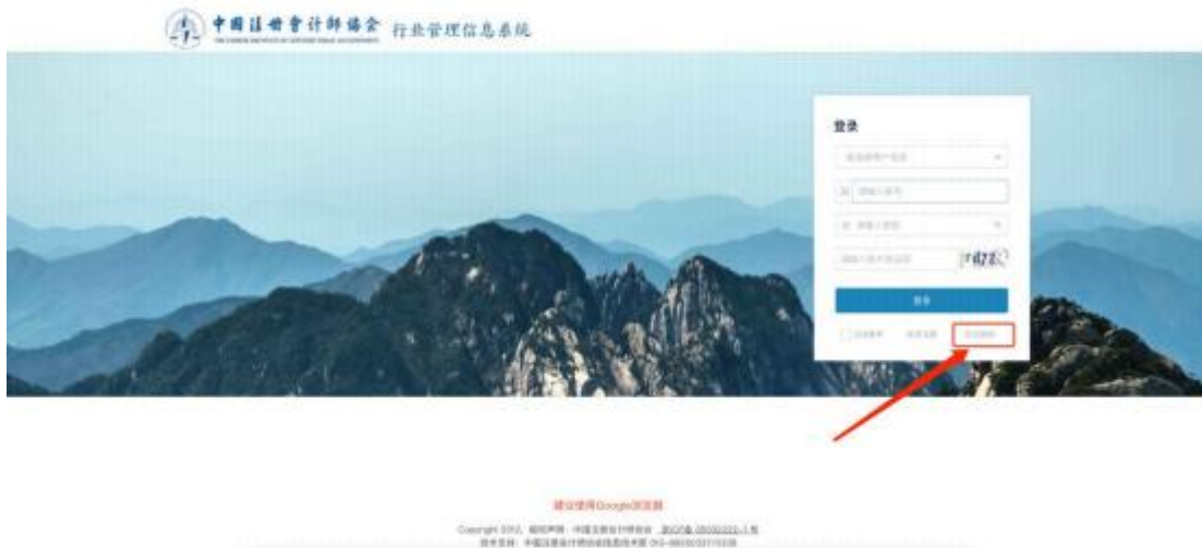
2-5 年检系统登陆界面

2、个人会员在密码重置界面用户类型选择注册会计师或非执业会员，账号填写完成后点击【下一步】跳转到验证码接收界面。