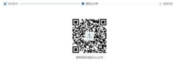
2-7 中国注册会计师协会行业管理信息系统公众号二维码界面

4、个人会员已绑定公众号时会展示验证码接收界面。点击发送验证码可将修改密码验证信息发送到公众号上。个人会员可通过公众号查看验证码，输入验证码后点击【下一步】跳转至新密码设置界面。