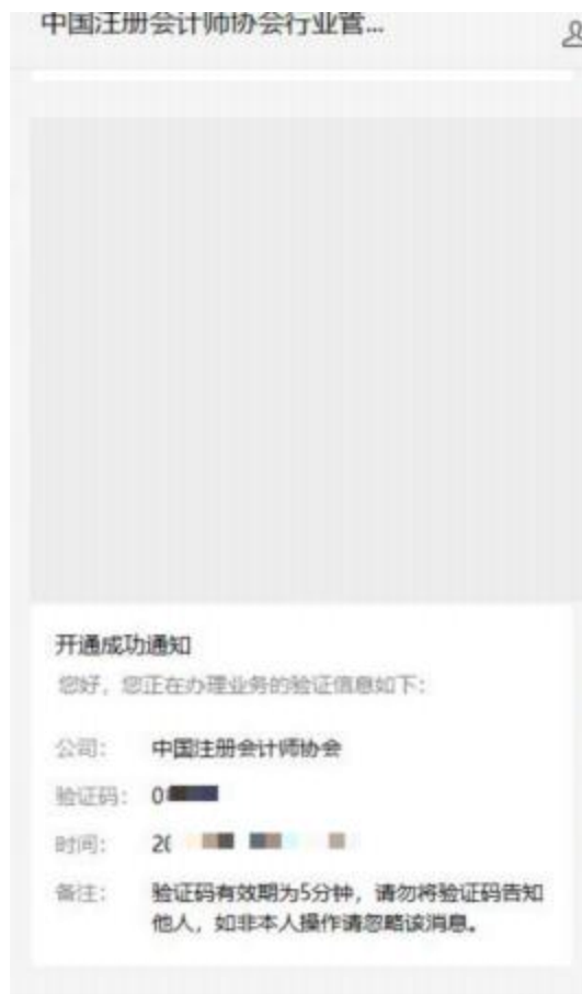
2-8 微信公众号接收验证码界面

4、个人会员已绑定公众号时会展示验证码接收界面。点击发送验证码可将修改密码验证信息发送到公众号上。个人会员可通过公众号查看验证码，输入验证码后点击【下一步】跳转至新密码设置界面。