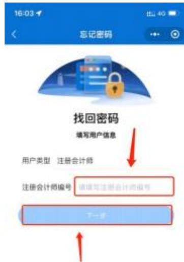
1-4 会员编号填写界面