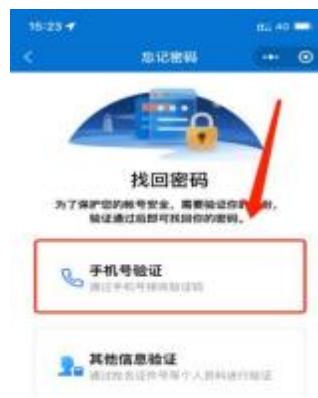
1-5 选择手机号验证界面

1、个人会员在信息验证时会员信息中留有正确手机号，可以通过手机号接收验证码方式找回密码。