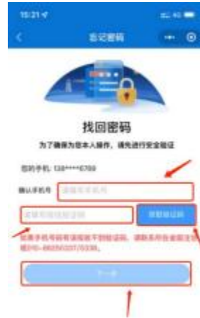
1-6 手机号验证码验证界面

2、填入完整的手机号码，点击获取验证码并输入验证码后点击【下一步】跳转到新密码设置界面。