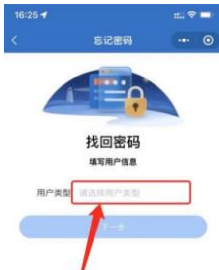
1-3 用户类型选择界面