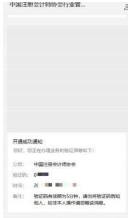
2-2 微信公众号验证码接收界面

2、个人会员在验证码接收界面点击获取验证码，验证码会发送到绑定的“中国注册会计师协会行业管理系统”微信公众号上。填写验证码后点击【下一步】跳转到新密码设置界面。